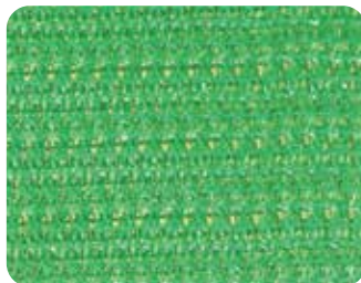
ペンキ飛散防止ネット実物写真

『ペンキ飛散防止ネット』は戸建住宅・アパート・マンションの塗装工事の中でペンキ飛散防止に使用できるメッシュネットです。直営の中国工場で、国産の機械を使い紡糸から編網まで一貫生産を行っているため、高品質でサイクルコストに優れた製品となっています。また、規格外のサイズにつきましても国内対応にて受注生産が可能です。省資源化やごみ削減にもつながり、地球環境保全に貢献します。