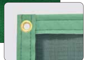
ペンキネット 周囲ハンプ加工