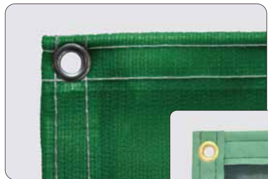
ペンキネット 周囲折り返し加工